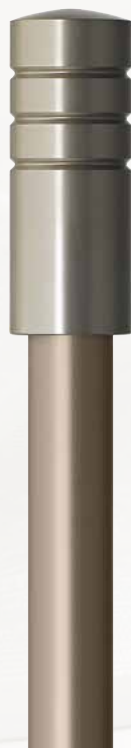
Zylinder 250 nickelfarbig matt