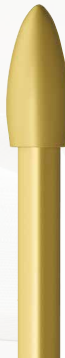
Tropfen 234 messingfarbig matt