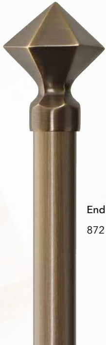
Endknopf 872 Messing bronziert